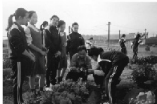
● 在機場舉辦耕種活動，雖然不割使用會產生閃光的物件攝攝攝攝，但不無收成。

2003年我們協助香港機場管理局，於1月至5月舉辦了機場有機耕種活動。為8間位於東涌的中小學合共120名師生，提供8課有機耕種課堂，指導在機場範圍內以有機耕種的方式種植蔬果，成績令人欣喜。