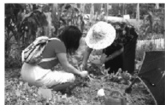
● 「荃灣金色有機園圃」，為長者提供與家人一起活動的機會。