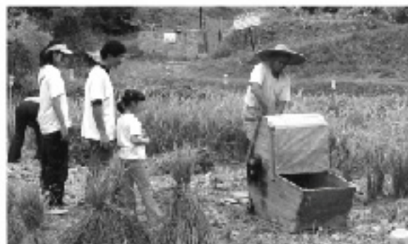
● 廣豐二號是少農少蟲的稻米品種，收成令人滿意。

總體來說，我們今年在發展新項目上，有令人滿意的成績，可以讓我們更有信心地繼續對市民作出有機教育，使大家對健康、食物安全、生態保育、以及全球環境，都有更深刻的體會。